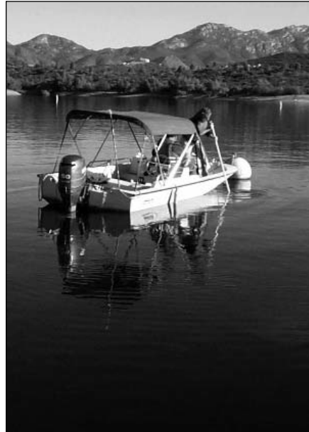
El reservorio del Lago Jennings ayuda al Distrito a almacenar, tratar y proveer agua a más de 260,000 personas en La Mesa, El Cajón, Lemon Grove y partes de Spring Valley y Lakeside.

Como siempre, agradeceremos la participación del público y sus comentarios sobre la actualización de la encuesta sanitaria del Lago Jennings durante nuestras reuniones de la Junta programadas regularmente. Puede solicitar un resumen de la evaluación llamando a la química sénior de Helix al (619) 667-6248.