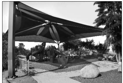
El área de camping del Lago Jennings cuenta con un área de juegos para niños.

Water Quality (Calidad del Agua) (619) 443-1031 24-Hour Water Emergencies (Emergencias de agua las 24 horas) (619) 466-3234