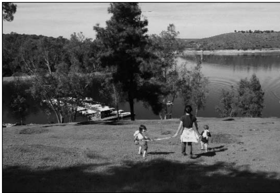
Disfrute de las vistas imponentes del Lago Jennings.

En febrero de 2011, se actualizó la encuesta sanitaria del Lago Jennings. El propósito de dichas encuestas es evaluar la cuenca hidrográfica para determinar la existencia y el potencial de peligros de fuentes de contaminación que podrían llegar al suministro de agua pública. La calidad del agua del Lago Jennings se considera vulnerable a: las aguas residuales, la recreación, el desarrollo, las