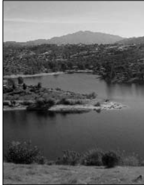
El Lago Jennings es el reservorio del Distrito. Tiene una capacidad de 9,790 acres-pie.

Este informe se rige por la Guía del Departamento de Salud Pública de California (California Department of Public Health) para el CCR, con fecha 1.º de enero de 2011. Es nuestra intención proporcionar este informe a todos nuestros consumidores. Si desea copias adicionales, puede obtenerlas llamando al (619) 443-1031. Si tiene alguna pregunta o inquietud sobre este Informe de Calidad del Agua, comuníquese con la química sénior de Helix al (619) 667-6248.